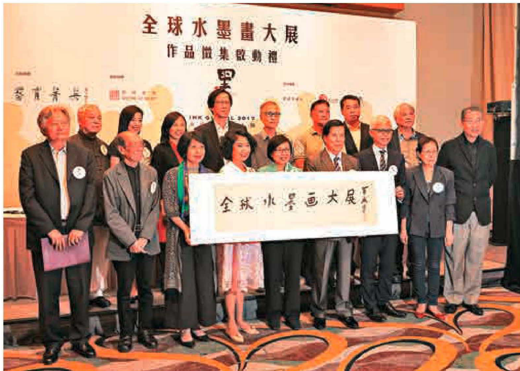
▲眾主禮嘉賓攜饒宗頤親筆題字「全球水墨畫大展」合影