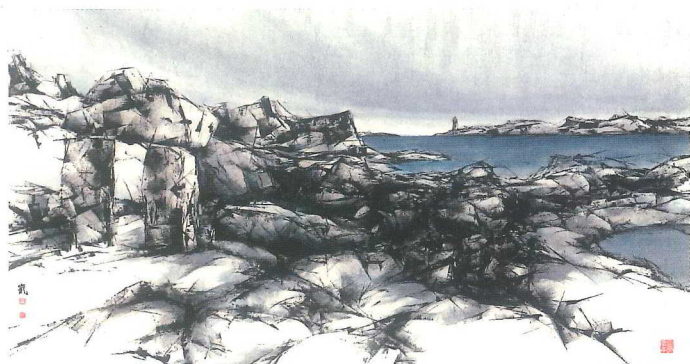
何紀嵐 哈利法克斯石岸系列—佩姬灣燈塔